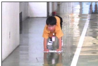
みんなのために働く

1 月に行く、2 月は逃げる、3 月は去るというように、3 学期はあっという間です。キラキラと輝く三和っ子の姿を大切にしながら、今年度のまとめをしっかりと行い、1～5 年生は次の学年に向け、6 年生は中学校に向けての準備をしていきたいと思っています。